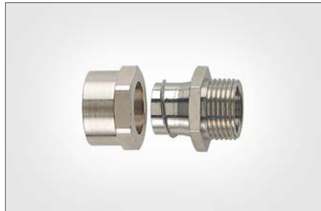
HelaGuard SCSB-FM mit starrem Außengewinde.