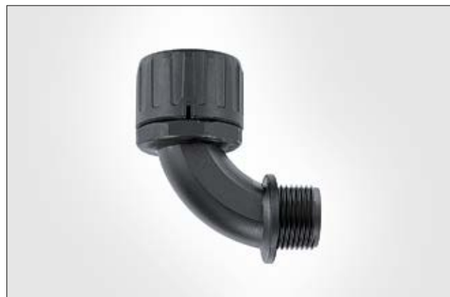
HelaGuard HG-90 90°-Verschraubung mit Außengewinde.