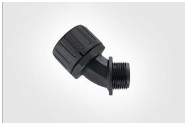
HelaGuard HG-45 45°-Verschraubung mit Außengewinde.