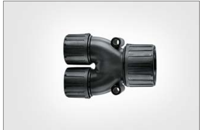
HelaGuard HG-Y Y-Verteiler, IP66.