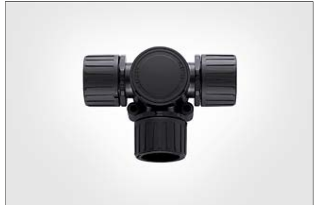
HeliaGuard HG-T T-Verteiler mit Inspektionsdeckel.