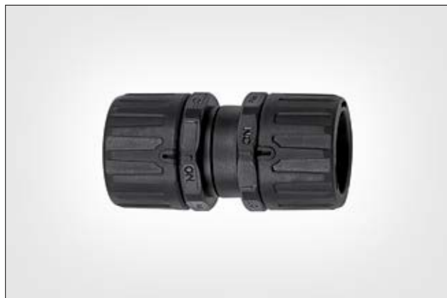
HelaGuard HG-HG Kupplung.